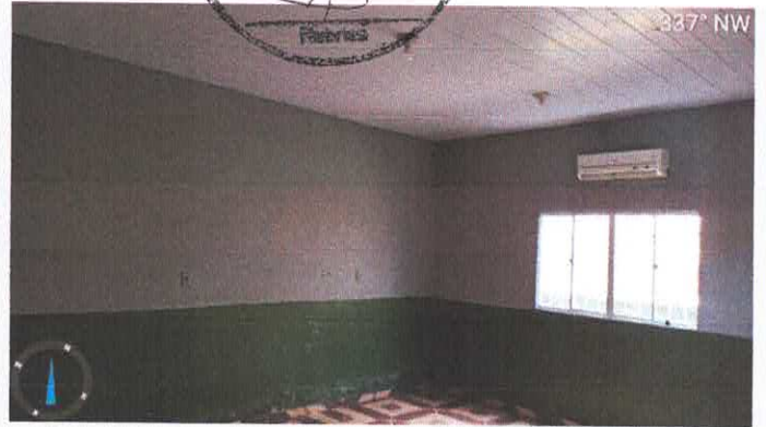
Imagens 7 a 10: Cozinha