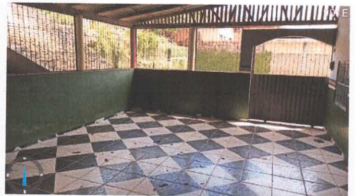
Imagens 13 e 14: Pátio de recreação