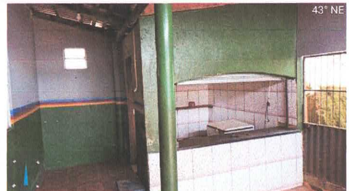
Imagens 5 e 6: Cozinha