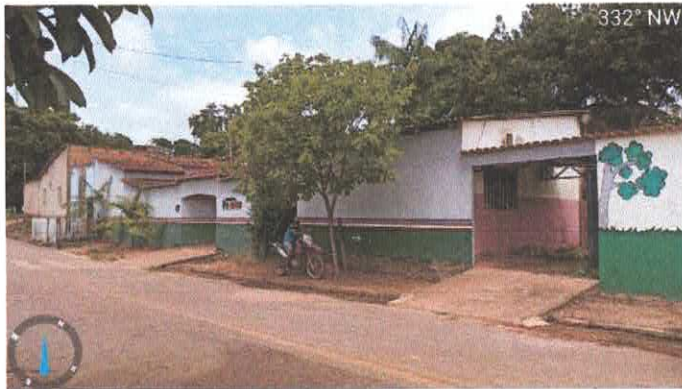
Imagem 1: Vista frontal do imóvel