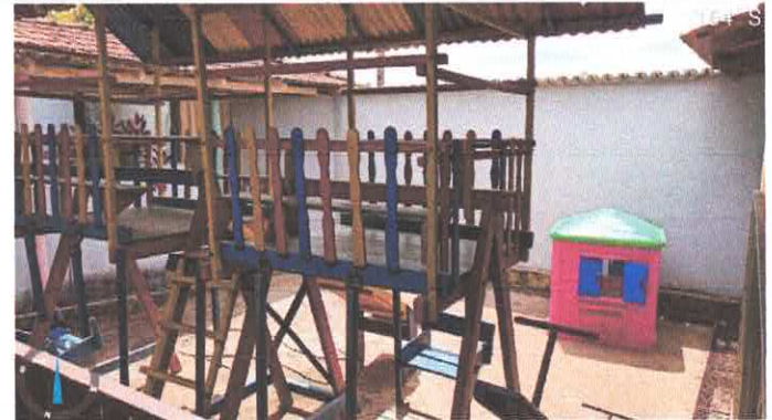
Imagem 4: Pátio Playground