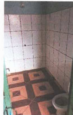
Imagens 11 e 12: Banheiros