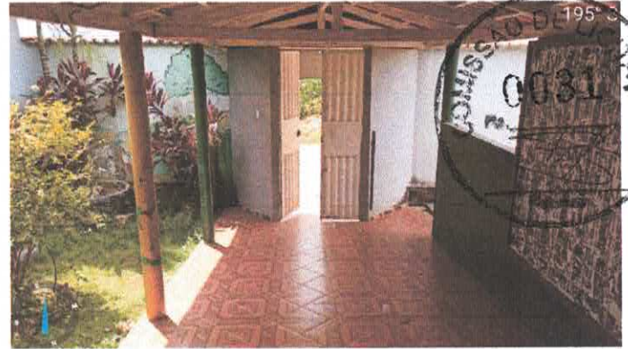
Imagem 2: corredor de acesso