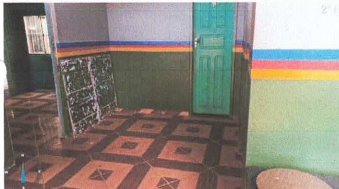
Imagem 3: Hall para salas