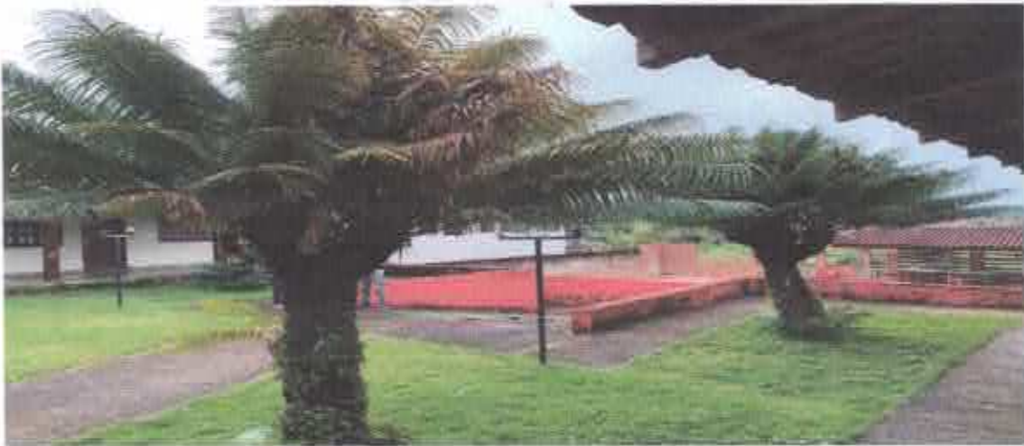
15ª Figura: jardins no centro da edificação.