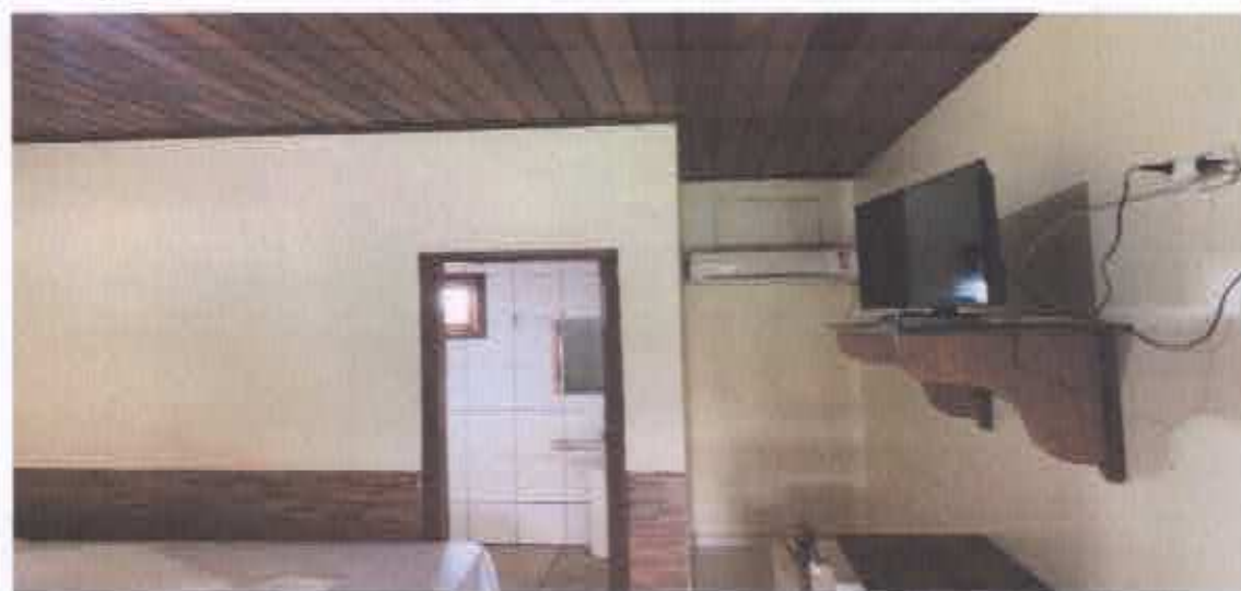
11° figura: suíte