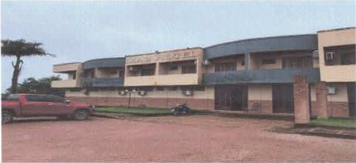
1ª figura; fachada frontal.