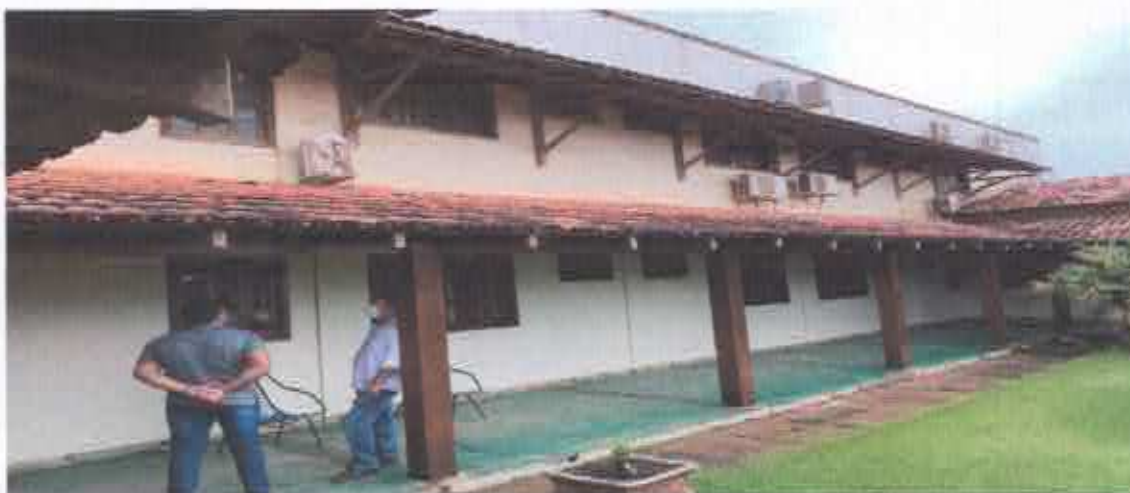
14ª Figura; circula externa jardins.