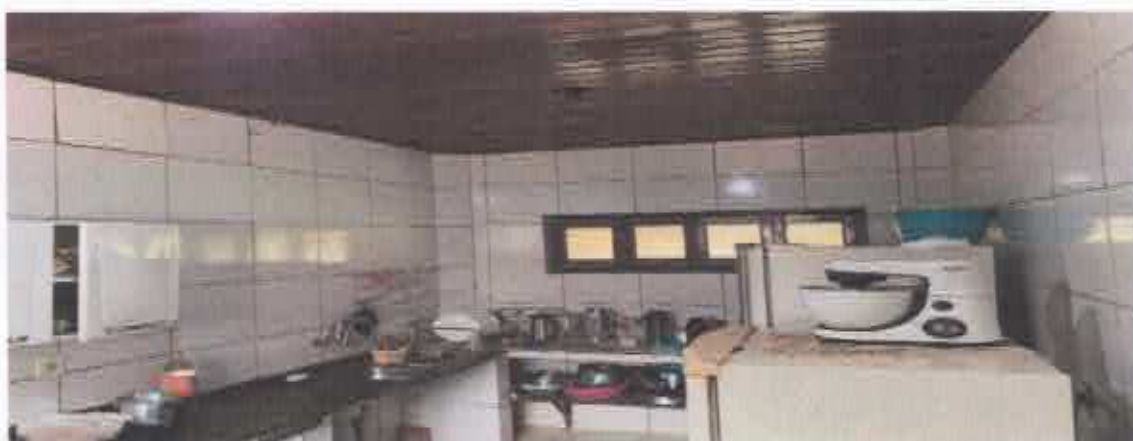
13ª Figura; cozinha.