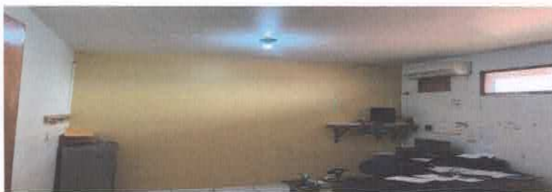
10° Figura; sala de administração.