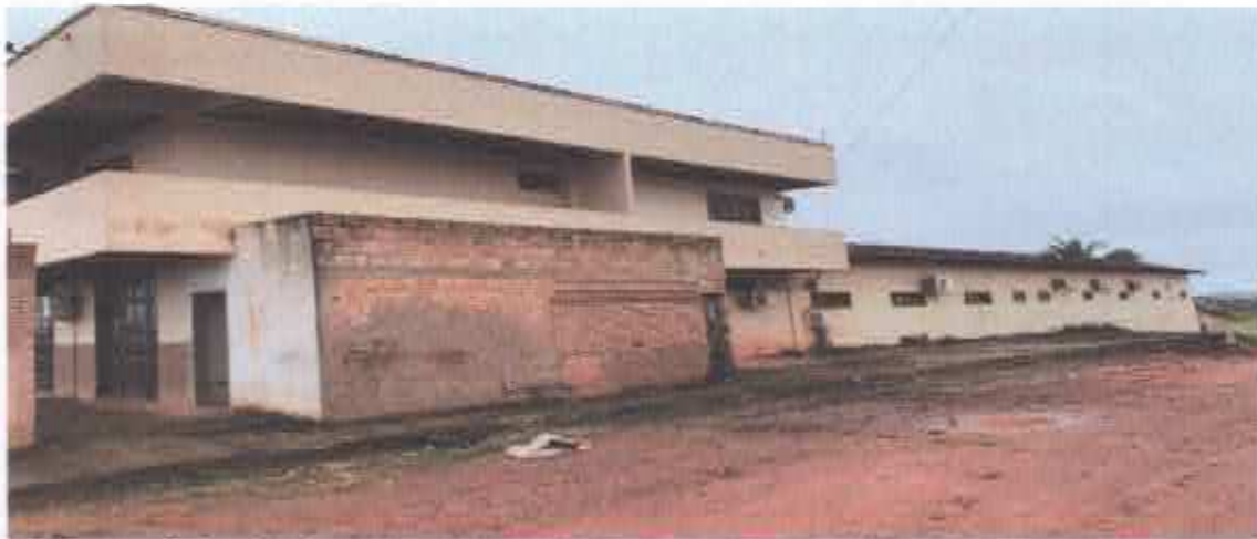
2ª Figura: fachada lateral.