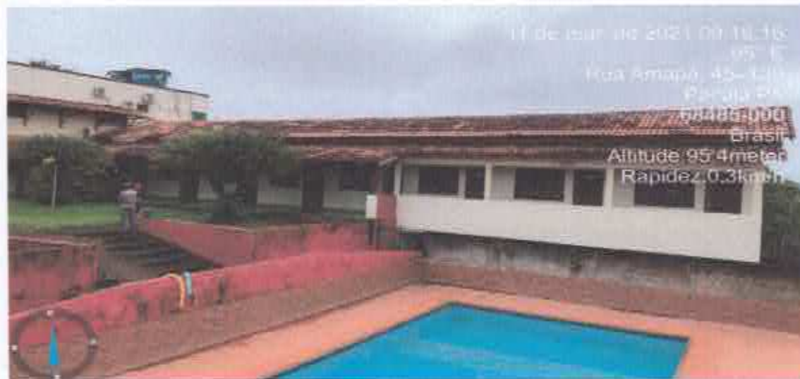
17ª Figura; prédio lateral área jardins.