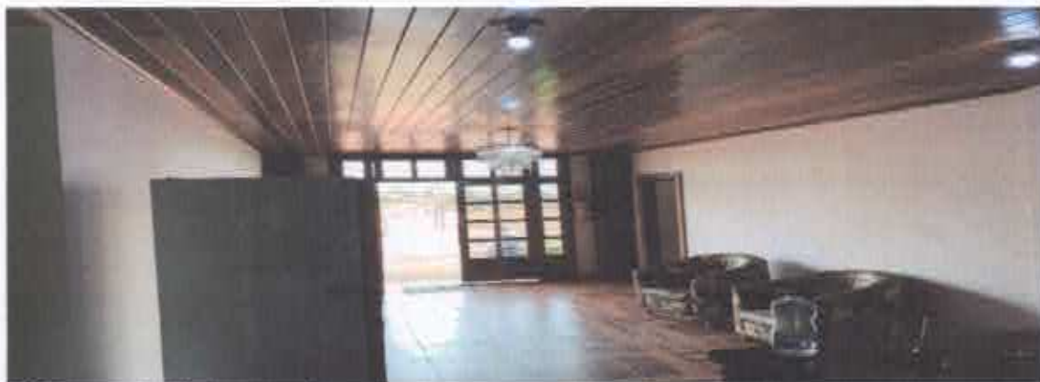
5° Figura: hall de entrada