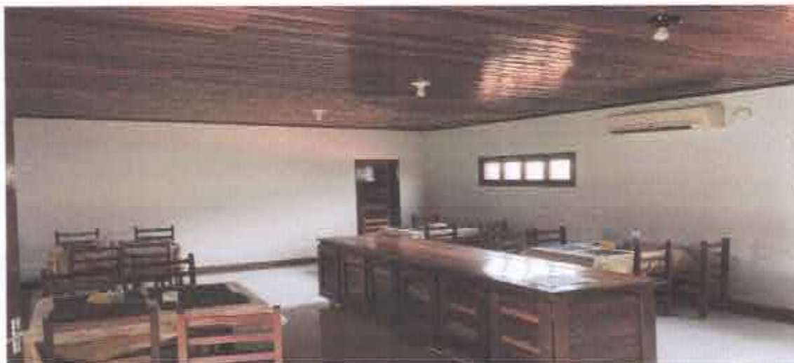
12ª Figura; refeitório