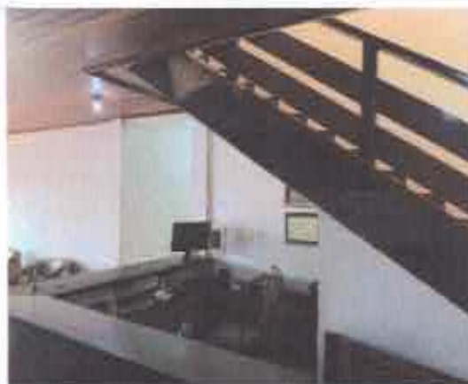
9° Figura; escada de assessor 1° pav.