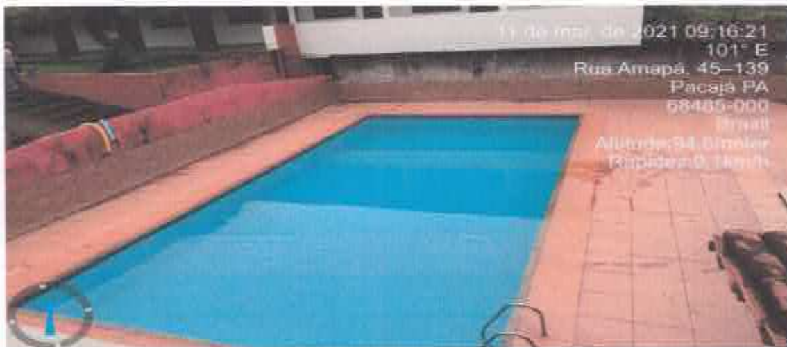
16ª Figura; área de lazer piscina.