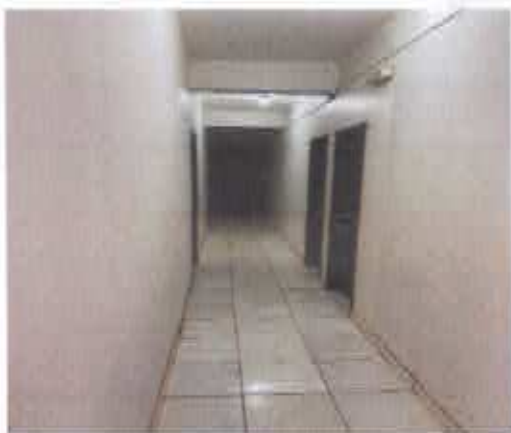
8° Figura; corredor.