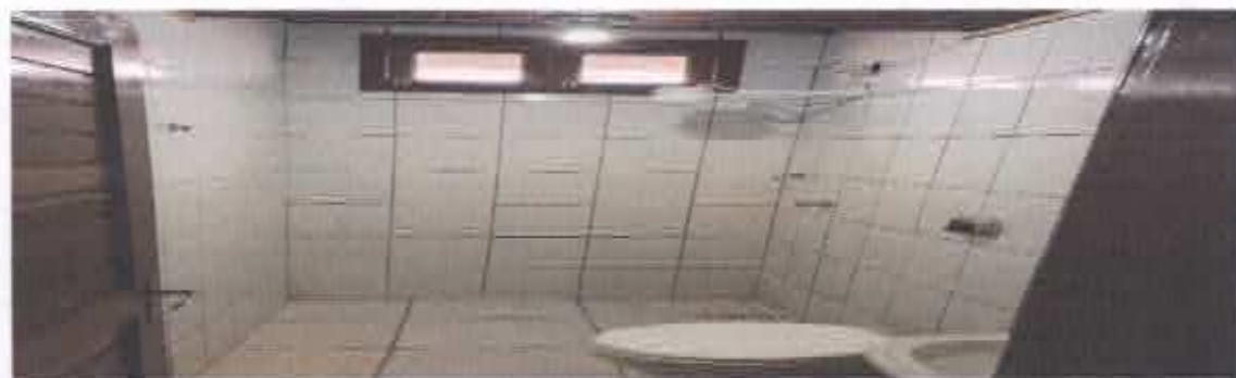
7° Figura: banheiro da suíte.