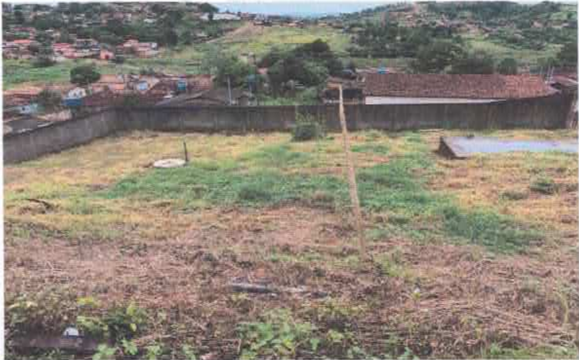
18ª Figura; terreno ao fundo da edificação.