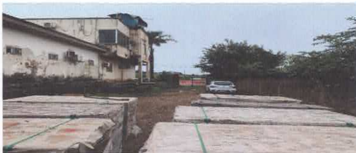
3ª Figura: garagem com portão de ferro duas folhas