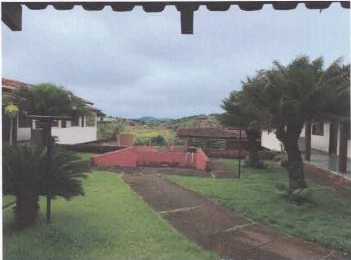
19ª Figura; vista frontal do jardim