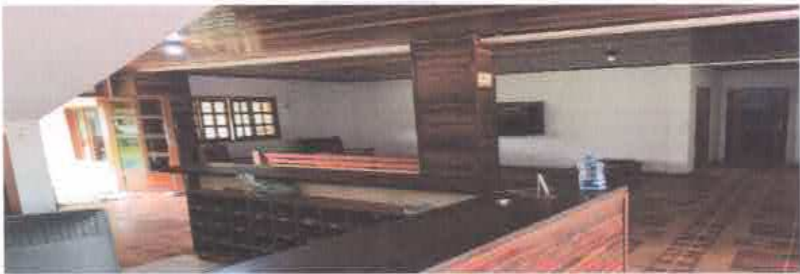
4° Figura: recepção