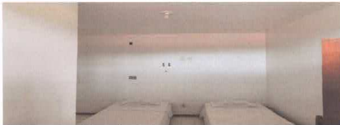
6° Figura: suíte padrão pavimento térreo